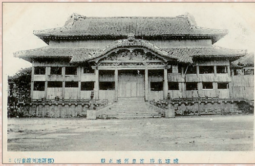
(左) 戦前の首里城と (右) 修復中の首里城大屋根 (撮影2025年5月9日)

首里城は、琉球王朝文化の象徴的な存在として沖縄観光の目玉ですが、実は、きわめて重要な戦争遺跡でもあります。今秋の再建公開に向け、戦争遺跡としての首里城に焦点を当てます。