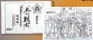
▲「土の戦士 満蒙開拓青少年義勇軍」内原(うちはら)版・満州版