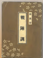
▲戦陣訓(1941(昭和16)年4月20日発行)