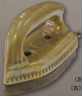
(左)旧陸軍軍服上下 (右)陶製電気アイロン