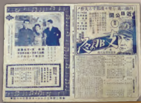
▲上海共同租界映画チラシ

「戦争が遺したモノたち」が、私たちに伝えたかった思いを感じ取っていただけたらと思います。本展が、あらためて平和の大切さを考える機会となることを願っています。