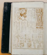
▲軍艦内の新聞「日向新聞」