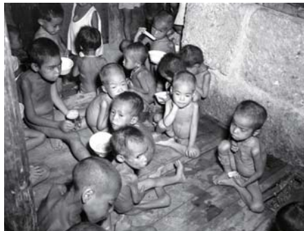
1945年コザ孤児院の子どもたち