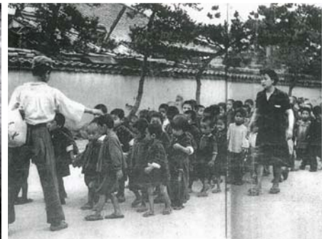
引き揚げてきた孤児たち(『敗戦・引き揚げの慟哭』飯山達雄著・写真集 国書刊行会)