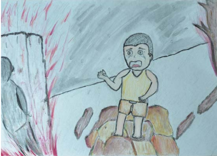
空襲で親をなくした戦争孤児 絵・藤井勇樹さん(父)