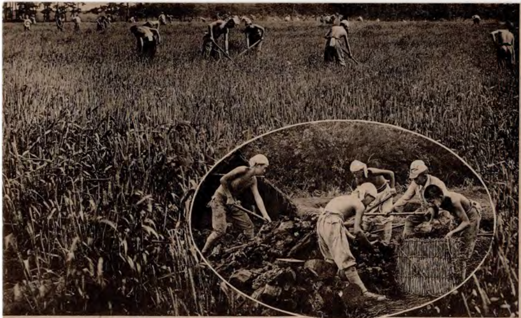
〔農事訓練〕製炭・作業