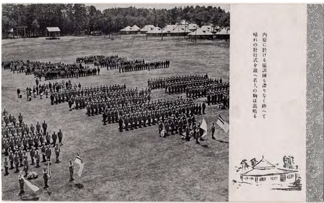
内原に於ける猛訓練も滞りなく終へて 晴れの壯行式を迎へ若人の胸は高鳴る