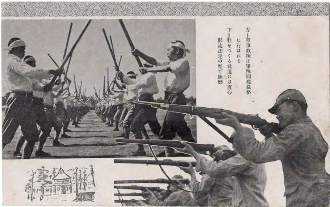
左↑軍事教練は軍隊同様嚴格 に行はれる 下↑肚をつくる武道には直心 影流法定の型で錬磨