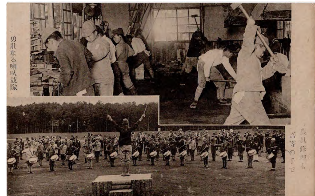
勇壯なる喇叭鼓隊