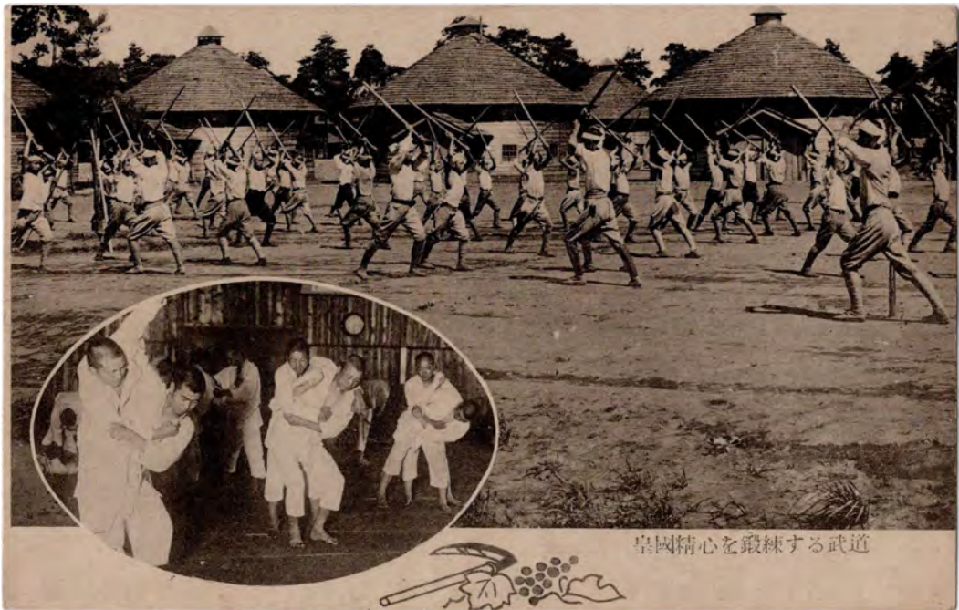
皇國精心を鍛練する武道