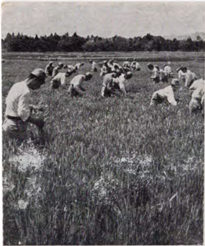
左一農耕は義勇軍の最も大切な訓練の一つである 右一標本室で實地に大陸の農作物を研究する