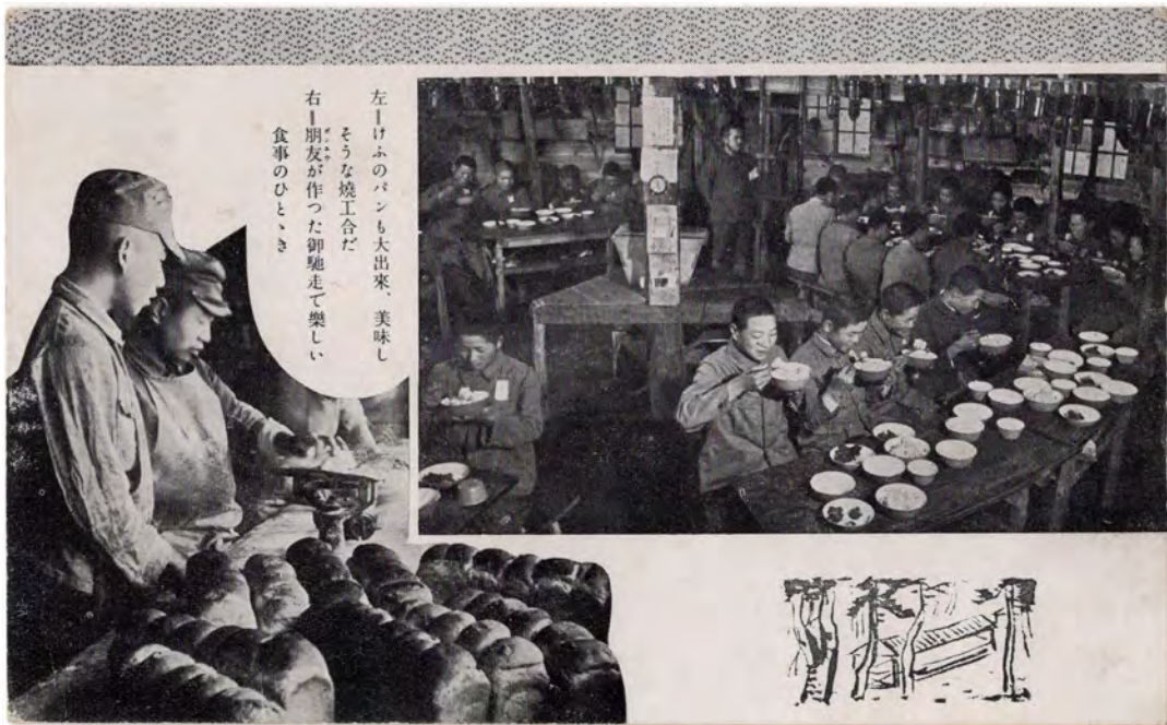
左↑けふのパンも大出来、美味し そうな焼工合だ 右↑朋友が作った御馳走で楽しい 食事のひととき