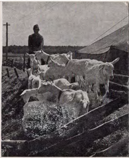
上↑家畜班の世話でめきめきと肥えて行く 下↑渡瀬までには一通り馬をこなせるやう になる