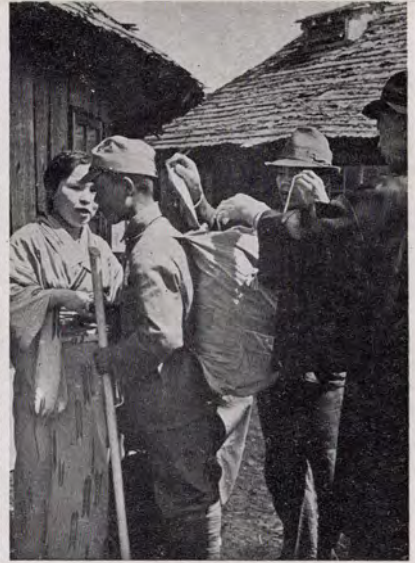
右一しっかりとやって来いよと激励されて別れを惜しむ面會のひと時 左一揃ひの製服に身を包み、歩武堂々訓練所を出發