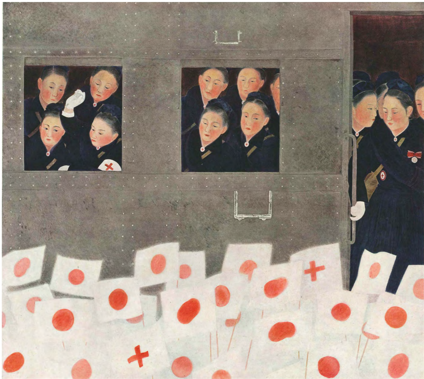
歡送（情報局推奨） 海鷲捷舞