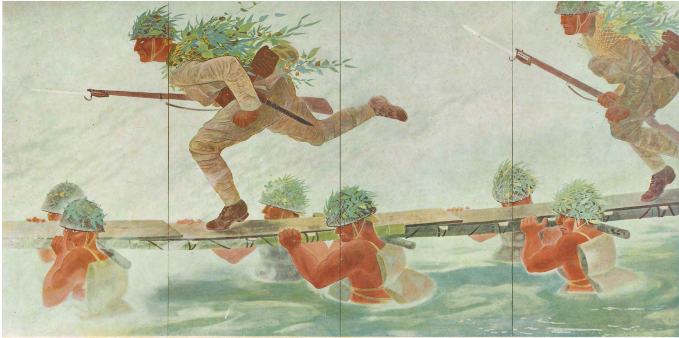
渡河 轍(わだち)の響(情報局推奨)