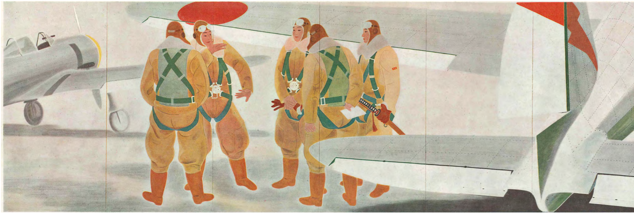
翼の勇士 その一瞬

生死を超越し一意任務の完遂 に邁進すべし。身心一切の力 を盡くし、従容として悠久の大 義に生くることを悦びとすべ し。