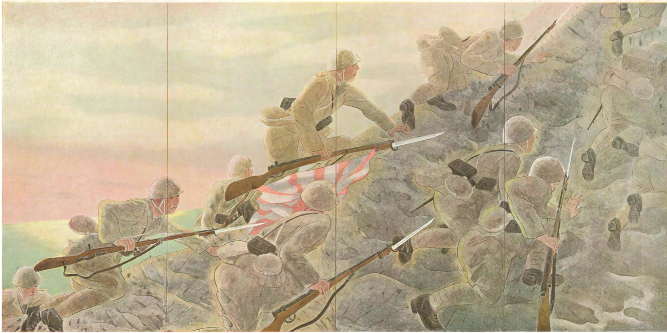
暁の一隊 ジャングルを衝(つ)く