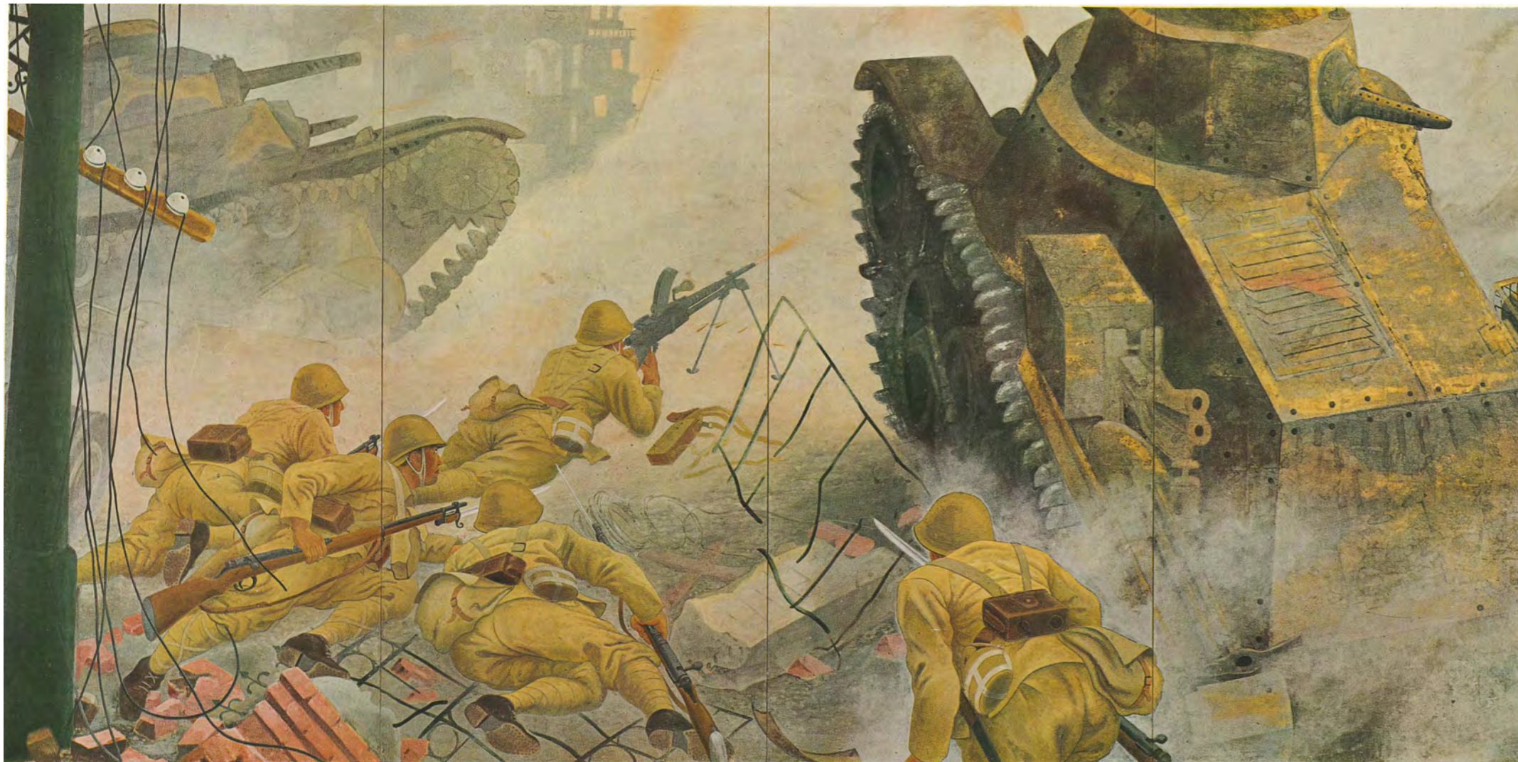
燻(くすぶ)る市街 春風唱和