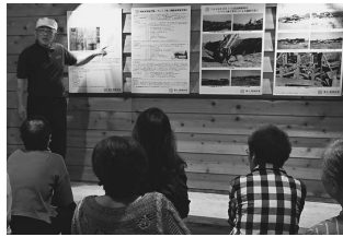
戦中・戦後の工場の様子を示すパネル(味噌蔵の一角に展示されている)

いまこの地域は広大な農地で農作物が育てられ、その近くには三菱自動車や愛知環状鉄道が走っており、南の方には旧東海道があり予科練の碑が建立されています。