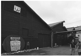
現在も使われている味噌蔵

味噌蔵の歴史に興味があり、ピースあいちの仲間とともに訪れた豊田にある「ますづかみそ」。この味噌蔵は第二次世界大戦当時、第三岡崎海軍航空隊の施設として使用され、戦時中は戦闘機の格納庫や兵舎として使われていました。全国から13000人の若者が集められ、主に戦闘機搭乗兵と整備士の訓練を受けた後、戦地に向かって行きました。