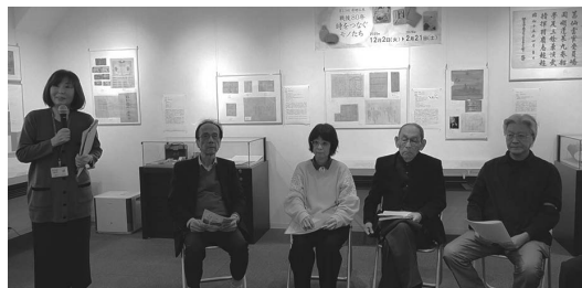
オープニングイベント