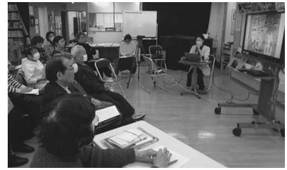
体験者の語り継ぎの試演会の様子 終了後、みんなで意見を言い合い、それを参考に語りをブラッシュアップしていく

戦争や紛争が世界各地で起こっている今日、「自分事」として平和を考える取り組みとして、戦争体験を語り継ぐ活動を充実していきたいと考えています。