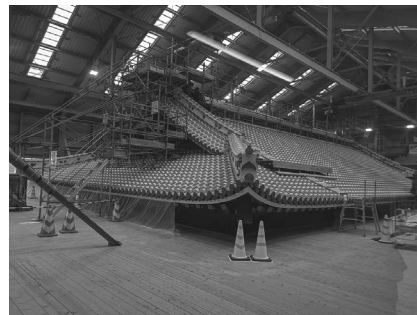
修復中の首里城 大屋根 (2025.5.9撮影)